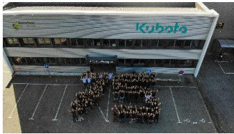
Celebration Les Landes-Genusson